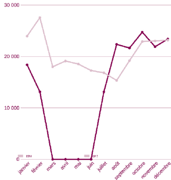
RÉPARTITION DE LA FRÉQUENTATION 2018