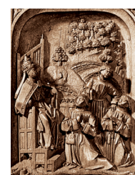
Ca. Saint Pierre envoie trois saints évangéliser le Beauvaisis