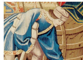
(fig. 5) Bonnet court au bord relevé (scène 16)