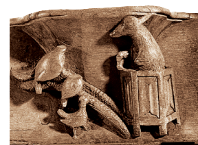
A4. Renart prêchant aux poules