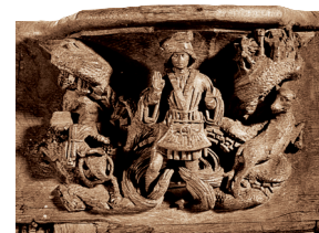
B6. Saint Eustache dans le torrent