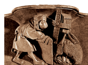
C7. Un homme souffle pour faire tourner les ailes d'un moulin