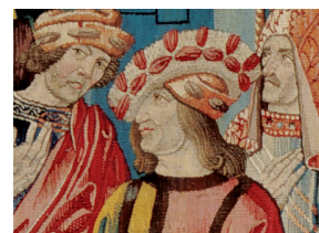
(fig. 6) Chapeau posé de biais (scène 4)