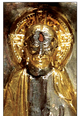
D. Cl. 22653 (détail)