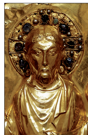
B. Cl. 2350 (détail)

* Estampé : décor en relief obtenu à partir d'un moule appelé matrice. * Niellé : coloré en gris par du nielle, un sulfure métallique. * Repoussé : technique permettant d'obtenir des reliefs en martelant le métal sur l'envers.