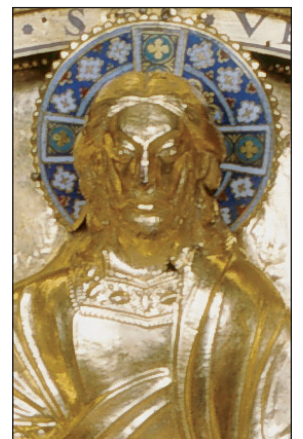
C. Cl. 13247 (détail)