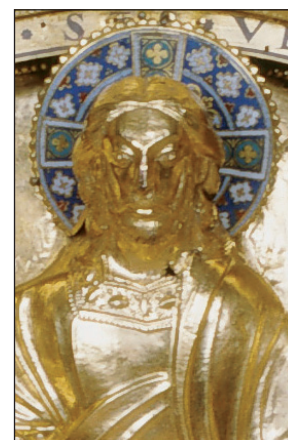
C. Cl. 13247 (détail)