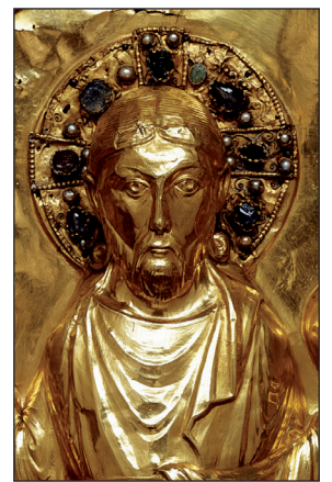
B. Cl. 2350 (détail)

Ce devant d'autel, fabriqué entre 1015 et 1022, peut-être à Reichenau, à Ratisbonne ou à Bamberg, plus probablement à Fulda, fut offert par l'empereur à la cathédrale de Bâle. Mais sa destination initiale était sans doute un monastère bénédictin - comme le laisse supposer l'inscription complexe qui magnifie saint Benoît - : peut-être l'abbaye-mère de l'ordre au Mont-Cassin, près de Rome, ou l'abbaye de Michelsberg, à Bamberg, fondée par Henri II. Si elle glorifie le Christ et saint Benoît, cette œuvre célèbre aussi l'empereur qui, malgré sa position d'humilité, est associé au Christ