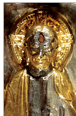
D. Cl. 22653 (détail)