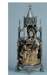
U. Cl. 3308 – vitrine 35