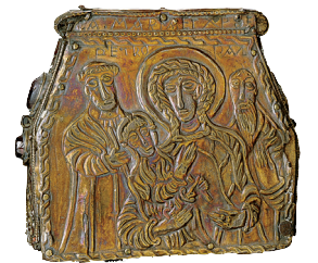
C. Cl. 13968 - vitrine 4