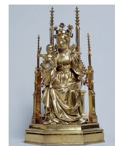
L. Cl. 3307 – vitrine 31