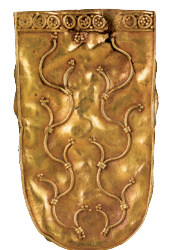
G. Cl. 3410 - vitrine 4