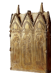
K. Cl. 10746 – vitrine 37