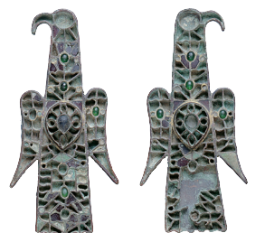
D. Cl. 3479-3480 - vitrine 5