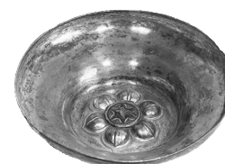
Q. Cl. 1951 – vitrine 28