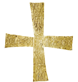
B. Cl. 14964 - vitrine 4

La période gothique, à partir du milieu du XII e siècle, marque un tournant dans le domaine de l'orfèvrerie. Paris s'affirme comme la capitale des arts précieux en Europe, surtout à partir du règne de saint Louis (1226-1270). La Sainte-Chapelle, construite de 1243 à 1248 au cœur du palais royal, est peu à peu dotée d'un important trésor d'orfèvrerie, dont l'une des rares pièces conservées,