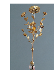
M. Cl. 2351 – vitrine 2 (détail)