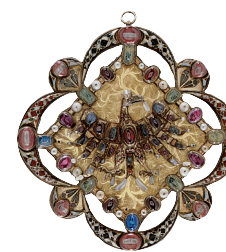
N. Cl. 3292 – vitrine 38