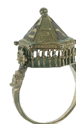
P. Cl. 20658 – vitrine 36