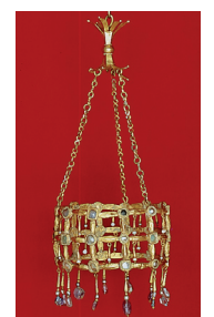
E. Cl. 3211 - vitrine 1