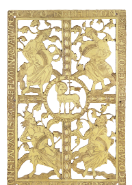
I. Cl. 1362 - vitrine 10