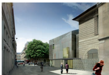
2. Nouveau bâtiment d'accueil : vue extérieure depuis la rue Du Sommerard, projection - dossier de concours