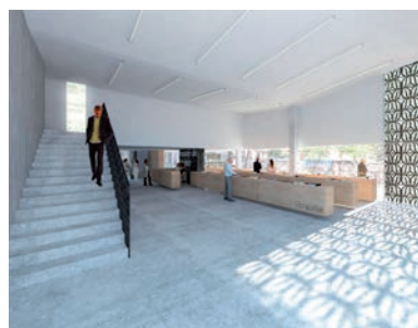
4. Vue intérieure du nouvel espace d'accueil : librairie, projection - dossier de concours