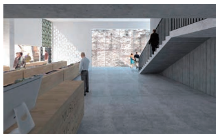
3. Vue intérieure du nouvel espace d'accueil, projection - dossier de concours