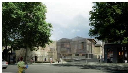
1. Nouveau bâtiment d'accueil : vue extérieure depuis le boulevard Saint-Michel, projection - dossier de concours

Merci d'indiquer les copyrights figurant à droite des visuels.