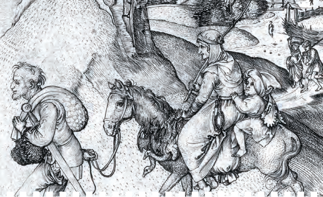
> Départ pour le marché. Colmar, vers 1470-1475.