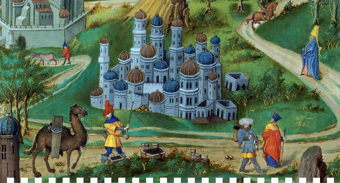
> Le voyage d'Outre-Mer. Vue de Jérusalem. France, fin du XV e siècle.