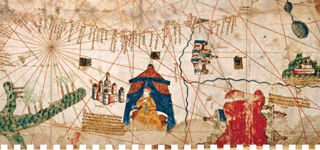
> Carte marine de la mer Méditerranée et de la mer Noire (détail). Italie, seconde moitié du XV e siècle.