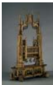
Berceau : Repos de Jésus Bois (chêne) ; autrefois doré et peint. Pays-Bas du Sud (Bruxelles ?), fin du XV e ou début du XVI e siècle Provient de l'Hôpital de Tirlemont (Tienen, Belgique) ; Acquisition 1998. Cl. 23607