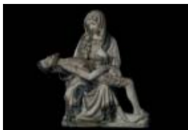
Vierge de pitié Pierre (calcaire) ; polychromie Salzbourg ?, vers 1390-1395 Acquisition 1999 Cl. 23656