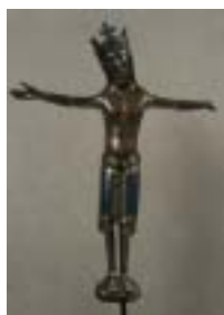
Christ roi crucifié Cuivre embouti, gravé, ciselé, champlevé, émaillé, doré et gemmé Limoges, vers 1210 – 1220 Acquisition 2001 Cl. 23671