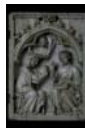
Le Couronnement de la Vierge Ivoire d'éléphant avec traces de polychromie Paris, premier tiers du XIV e s. Acquisition 1998 Cl. 23542