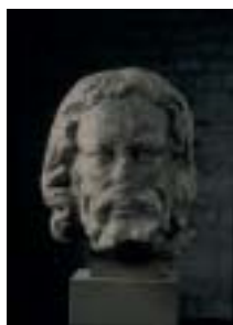
Tête d'homme provenant de notre Dame de Paris Pierre (calcaire) Paris, milieu du XIII e s. Mise au jour lors des travaux réalisés en 1977 dans les sous-sols de l'ancien hôtel Moreau, Paris. Don de la banque Natexis 1998 Cl. 23606