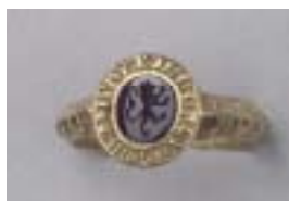
Bague-cachet de Guillaume de Flouri Or, améthyste Italie (?), fin du XIII e siècle Acquisition 1995 Cl. 23430