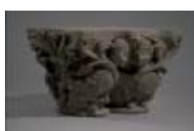
Chapiteau double : Harpies affrontées Pierre (calcaire) ; traces de polychromie Saint-Denis, vers 1140 – 1145 Provient du cloître de l'abbaye de Saint-Denis Acquisition 1996 Cl. 23531